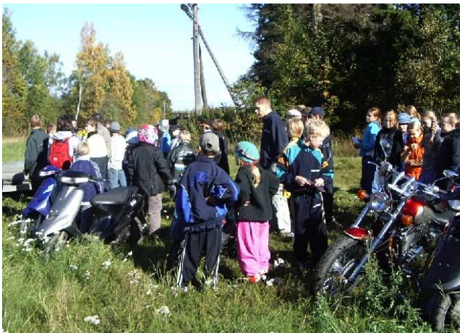
Juba kase ladvalt lehed langevad, kõle tuul käib üle kesamaa. (L. Koidula)

02. oktoobril toimunud sportlik perepäev tõi Vooremäele kokku hulgaliselt rõõmsameelseid lapsi, nende vanemaid ja ka vanavanemaid.