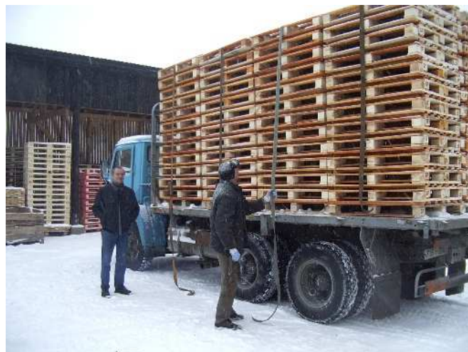
järjekordne partii valmistoodangut alustamas teekonda tarbijani

Kokku on pidevalt tööl 10 inimest, minu ja raamatupidajaga kaasaarvatult. Haaslava vallast on töölisi 3, ülejäänuid veame oma väikebussiga linnast. Midagi pole teha, kui kohapealt töötegijaid ei leia. Põhiliselt töötame neli päeva nädalas ja tööpäevad on selle võrra pikemad. Sellise töövõtuga on paranenud aga tootlus, kuna vähenevad ettevalmistamise ja lõpetamise ajad. Ka mehed ise on väga rahul, sest saavad oma vaba aega paremini kasutada.