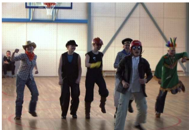
Tundsiti ära? Sillaotsa PK tantsurüpp esinemishoos