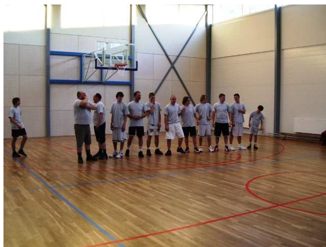
Haaslava valla korvpalli meeskond

Esimene poolaeg lõppes valla eduseisuga 11 : 21. Teisel poolajal suudeti oma edu hoida ja võideti skooriga 36 : 38.