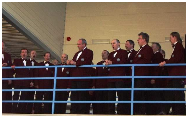
Muusikalised tervitused ja mehed soovid Haaslava Meeskoorilt