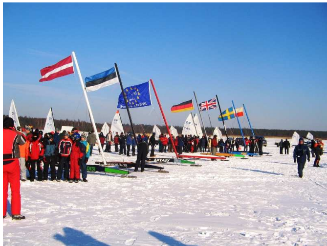
Jääpurjekad valmistumas stardiks